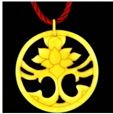
Loto di buon auspicio