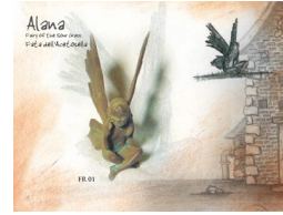
“The Iron Fairies”

Quando porti a casa la tua fatina del ferro la prima notte sistemala in modo che i primi raggi del mattino la illuminino.