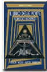
“Il libro delle porte “