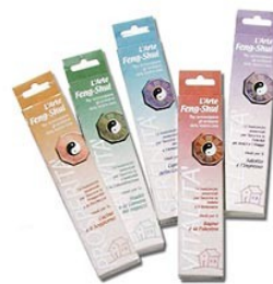
Armonia del Feng-Shui