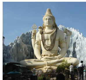
“Stautu di Shiva a Bangalore”