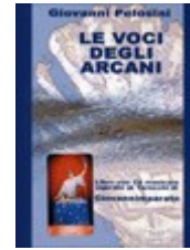
“Le Voci degli Arcani “