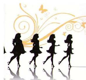
“ Paris Mac Mairi”