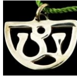
Ciondolo del vento